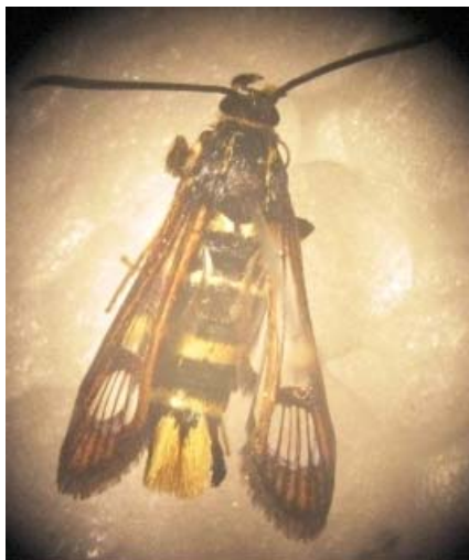
شکل ۴- حشره کامل S. caucasica Figure 4- The adult of S. caucasica