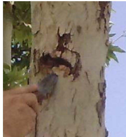
شکل ۱- خسارت S. caucasica روی درخت چنار Figure 1- The damage caused by S. caucasica on plane trees