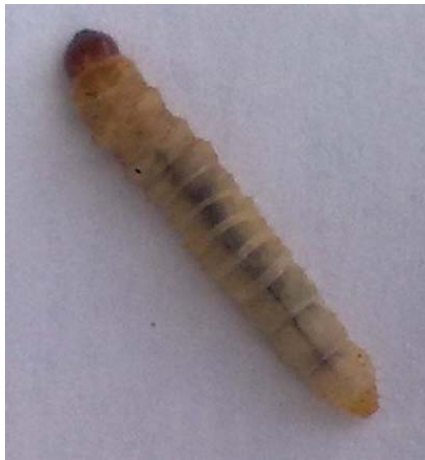
شکل ۲- لارو سن سوم S. caucasica Figure 2- The 3 rd instar larva of S. caucasica