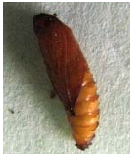
شکل ۳- شفیره S. caucasica Figure 3- The pupa of S. caucasica