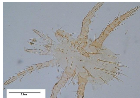
شکل ۳- مرحله لاروی کنه Cercoleipus n.sp. Figure 3. Cercoleipus n.sp. , Larva