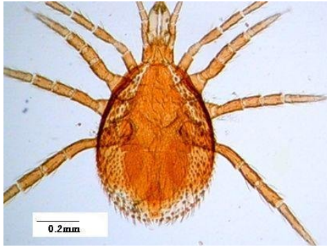
شکل ۲- کنه ماده Cercoleipus n.sp. Figure 2. Cercoleipus n.sp. , Female