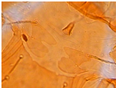
شکل ۶- دو صفحه‌ی چاک‌دار jugular در گونه Cercoleipus n.sp. Figure 6. Two jugular shields with suture in Cercoleipus n.sp.