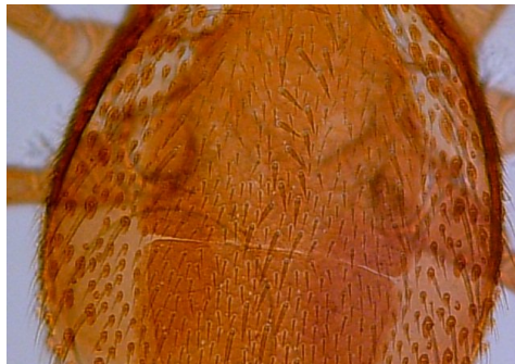
شکل ۴- وجود شکاف بین صفحه‌ی podonotum و opisthonotum در کنه ماده Cercoleipus n.sp. Figure 4. Distinct suture between podonotum and opisthonotum Shields in female of Cercoleipus n.sp.