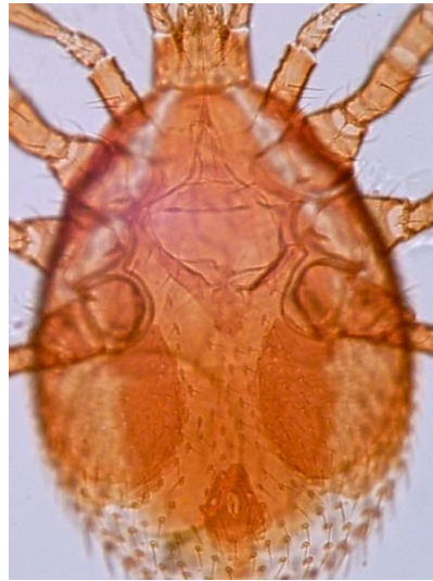
شکل ۷- صفحه بندی سطح شکمی در