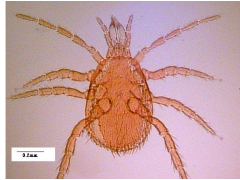
شکل ۱- کنه نر Cercoleipus n.sp. Figure 1. Cercoleipus n.sp. , Male