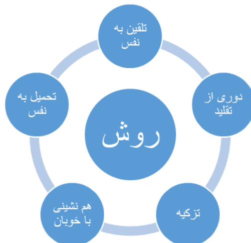
شکل ۱. روشن