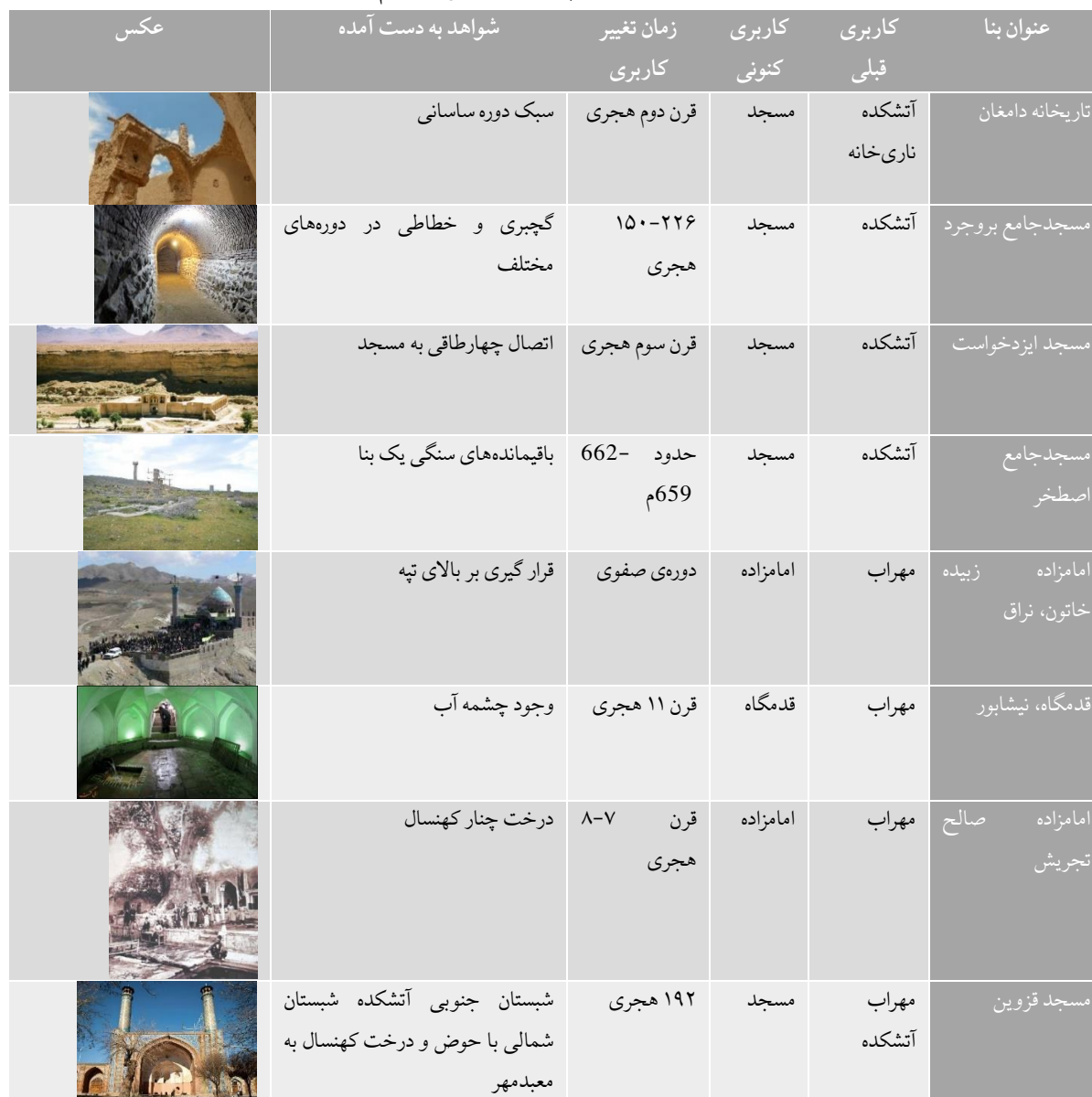
جدول ۳: نمونه‌هایی از بناهای مقدس با پیشینه معابد قبل از اسلام، ماخذ نگارندگان

با استناد به تحقیقات صورت گرفته از منابع تاریخی، یافته‌های باستان‌شناسی، ادعاهای افراد بومی و نشانه‌های باقی‌مانده از معابد گذشته (مانند نشانه‌های طبیعی در مهرابه‌ها و آتشدان‌ها در آتشدکه) جدول ذیل اشاره به نمونه‌هایی از مسجد، امامزاده و قدمگاه دارد که قبل از اسلام آتشدکه یا مهرابه بوده و پیش‌تر در پژوهش‌هایی به بررسی کامل و جامع‌تر این نمونه‌ها پرداخته شده است. در مقاله‌ی «استمرار روند تبدیل آتشدگاه به مسجد تا قرن هفتم هجری، نمونه‌ی موردی، مسجدسنگی داراب» نویسندگان با بررسی آثار و نشانه‌های به‌جامانده در مسجدسنگی به این نتیجه رسیده‌اند که این مکان قبلاً آتشدکه بوده است. مسجد ایزدخواست و مسجدجامع استخر نیز در مقاله‌ی «فرایند تبدیل دو آتشدکه به مسجد در ایزدخواست و استخر با استناد به شواهد موجود و منابع تاریخی» به صورت ریز و دقیق مورد بررسی و تحلیل قرار گرفته‌اند؛ همچنین مقاله‌ی «تحولات تاریخی مسجدجامع دماوند با استناد به شواهد باستان‌شناسی» اشاره به این مطلب دارد که روایات محلی تأکید بر آتشدکه بودن مسجدجامع دماوند دارند.