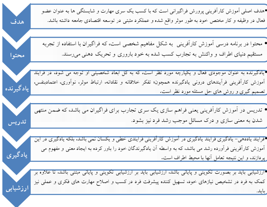
شکل ۱. چارچوب مطلوب عناصر برنامه درسی آموزش کارآفرینی در آموزش عالی