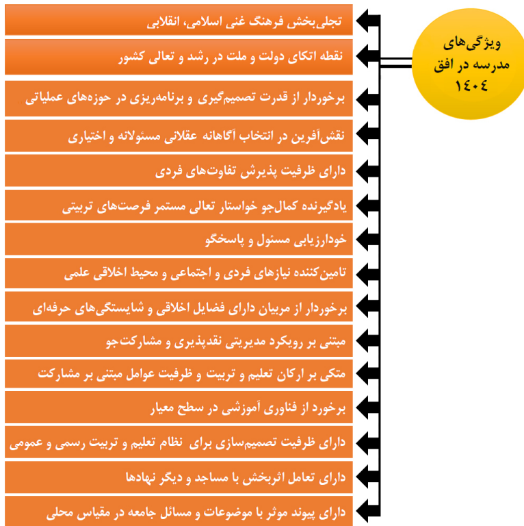
نمودار ۳- ویژگی‌های مدرسه در افق ۱۴۰۴

خدمات و فرصت‌های تعلیم و تربیتی، زمینه‌ساز درک و اصلاح موقعیت توسط دانش‌آموزان و تکوین و تعالی پیوسته هویت آنان براساس نظام معیار اسلامی در چارچوب فلسفه و رهنامه نظام تعلیم و تربیت رسمی و عمومی جمهوری اسلامی ایران دارای ویژگی‌های زیر است: