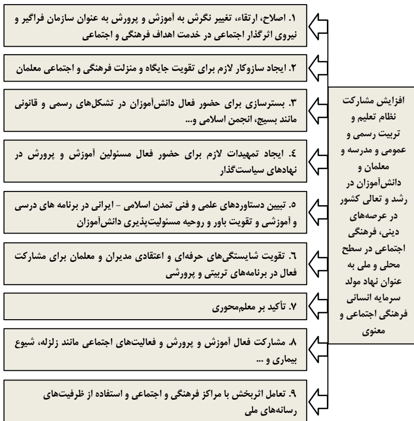
جدول ۱۱- افزایش مشارکت نظام تعلیم و تربیت

افراد، گروه‌ها و طبقات گوناگون را فرامی‌گیرد و مردم چه بخواهند و چه نخواهند، تحت تأثیر آن قرار می‌گیرند (جمالی، ۱۳۷۸).