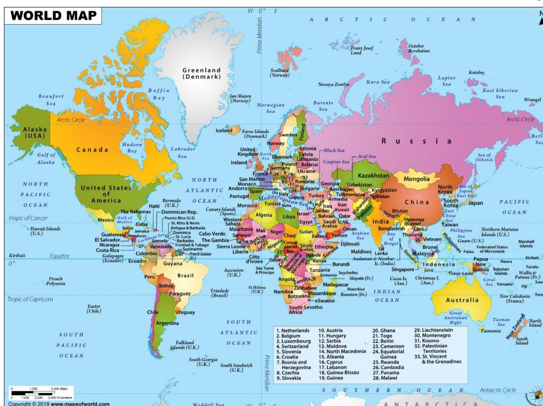
نقشه ۲: جغرافیای سیاسی جهان در قرن بیست و یکم

المللی آن سرزمین را بر عهده داشته است. مفهوم «کشور جدید و مستقل» شامل وضعیت های استعماری سابق و دیگر سرزمین‌هایی چون سرزمین‌های غیرمستقل، سرزمین های تحت مدیریت و سلطه سابق می‌شود که یا مسئولیت روابط خارجی را دارا بودند و یا چنین شناختی نداشتند. بنابراین شمار زیادی از این «کشورهای جدید و مستقل» با توجه به تعاریف بالا بر خلاف وفق و تصمیم دولت و کشور پیشین خود به جدایی و استقلال می‌رسند و حق تعیین سرنوشت را دارند. ۱ اما همانطور که گفته شده شاید در اول تصور شود که این حالت نوعی جدایی می‌باشد. براساس اعلامیه روابط دوستانه مجمع عمومی سازمان ملل متحد، این سرزمین‌ها دارای وضعیت حقوقی جدیدی مستقل از سرزمین اداره کننده خود هستند.