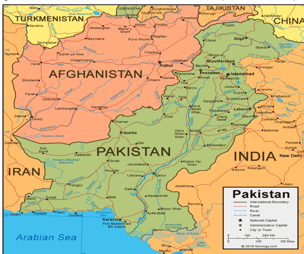
نقشه شماره ۱: موقعیت کشور پاکستان

(۵۶۵ مایل) از طرف جنوب غرب با ایران مرز دارد. پاکستان بر اساس آمار تخمینی (۲۰۱۷)، جمعیتی حدود ۲۰۰۰۰۰۰۰ تن دارد. پاکستان ششمین جمعیت بزرگ جهان را داراست که بیشتر از روسیه و کمتر از برزیل است.