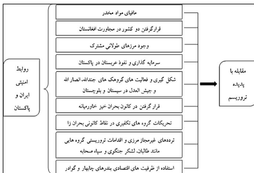
شکل ۲: الگوی روابط امنیتی ایران و پاکستان در مقابله با پدیده تروریسم از سال ۲۰۰۱ تا ۲۰۱۷