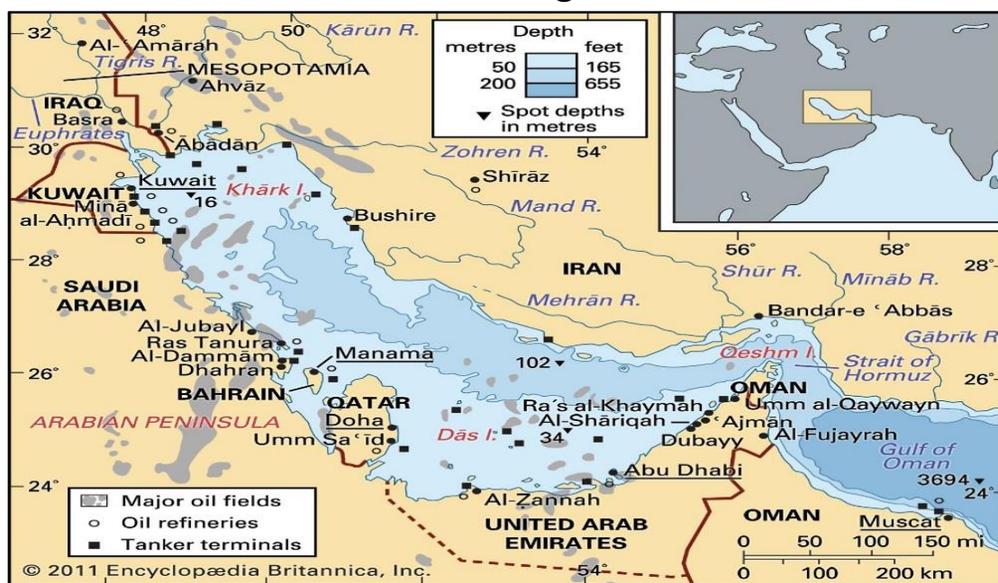
نقشه ۱: موقعیت جهانی و منطقه‌ای خلیج فارس

خلیج فارس (به زبان فارسی و به عربی الخلیج الفارسی) در ۲۴ تا ۳۰ درجه و ۳۰ دقیقه عرض شمالی و ۴۸ تا ۵۶ درجه و ۲۵ دقیقه طول شرقی از نصف النهار گرینویچ قرار دارد (Afshar Sistani, 2007).