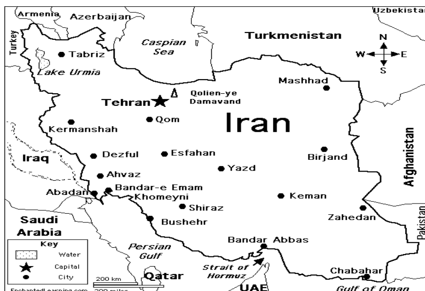
نقشه شماره ۱- مرزهای ایران

جمهوری اسلامی ایران دارای همسایگان متعدد و مرزهای مشترک طولانی با کشورهای همسایه است. از بین ۳۱ استان کشور ۱۶ استان، استان‌های مرزی محسوب می‌شوند که بر اساس آخرین سرشماری در سال ۱۳۹۰ بیش از ۴۵ درصد جمعیت کشور را در خود جای داده‌اند. نیمی از جمعیت کشور در استان‌های مرزی ایران با داشتن بیش از ۸۷۰۰ کیلومتر مرز خشکی و آبی با ۷ کشور عراق، آذربایجان، ارمنستان، ترکمنستان، پاکستان، افغانستان و ترکیه دارای مرز خشکی و با ۶ کشور روسیه قزاقستان (در شمال)، کویت، قطر، امارات متحده عربی و بحرین (در جنوب) دارای مرز آبی است (Akhavi, 2012: 106).