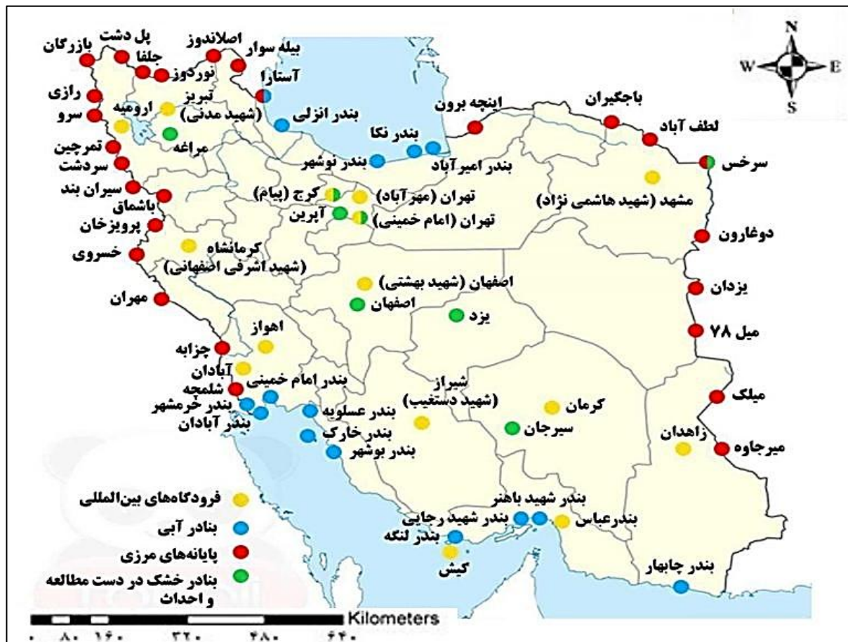
نقشه شماره ۲- بازارچه‌های مرزی ایران

صادرات از محل تجارت چمدانی به لحاظ ارزشی بوده‌اند. بدین ترتیب در هشت ماهه سال ۱۳۹۵ میزان صادرات از محل تجارت چمدانی به لحاظ ارزش ۲۹۲/۴۵ میلیون دلار و میزان صادرات از بازارچه‌های مرزی ۲۴۵/۶۲ میلیون دلار بوده است (Ibid., 2013: 101).