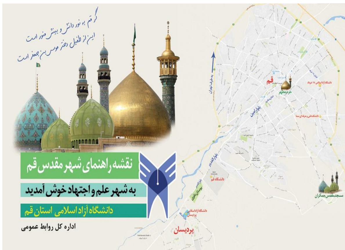
نقشه ۱: راهنمای شهر قم