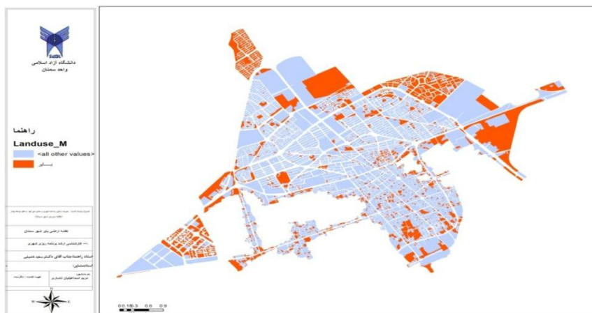
شکل ۲- موقعیت اراضی بایر در شهر سمنان