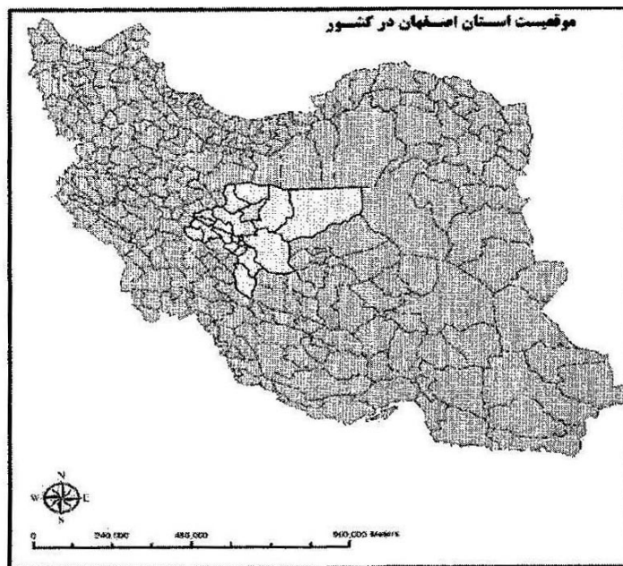
نقشه شماره (۱): موقعیت استان اصفهان در تقسیمات کشوری

ظروف سفالی، به طور کامل پخته شده و نقش و نگار و رنگ آمیزی آن هم تکامل یافته است. اشیاء ساخته شده از مس و برنز و استخوان جانورانی مانند: