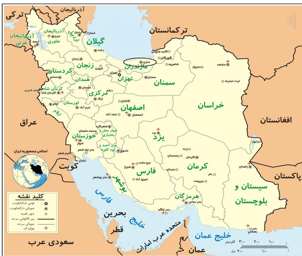
نقشه شماره ۱- موقعیت شهر ساری در ایران

شهر ساری در بخش شمالی شهرستان ساری قرار گرفته است. شهرستان ساری در استان مازندران و در ۳۶ درجه و ۴ دقیقه تا ۳۶ درجه و ۴۷ دقیقه عرض شمالی و ۵۳ درجه و ۲ دقیقه تا ۵۳ درجه و ۲۷ دقیقه طول شرقی واقع شده است و مساحت آن ۳/۲۴۸/۴۰۰ متر مربع است. از شمال و شمال شرقی به دریای مازندران و شهرستان بهشهر، از جنوب و جنوب شرقی به رشته‌کوه‌های البرز و استان سمنان، از مشرق به شهرستان میان‌دورود و از مغرب به شهرستان‌های قائم‌شهر، سوادکوه و جویبار محدود است. با توجه به آخرین آمار و اطلاعات جمعیتی به دست آمده، شهر ساری در سال ۱۳۹۰ جمعیتی حدود ۲۹۹۵۲۶ نفر داشته است. در شکل شماره یک موقعیت شهر ساری در کشور نشان داده شده است.