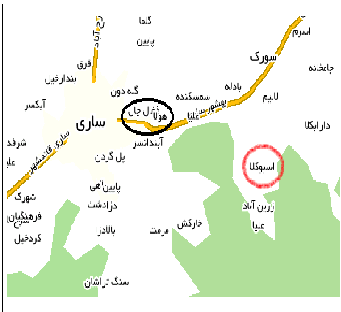
نقشه شماره ۴- نحوه استقرار روستای آهیدشت در شهرستان ساری

این روستا به نحوی در جبهه شمال شرقی شهر ساری واقع شده است که بخشی از بافتان درون محدوده شهری جای دارد و دسترسی به آن از طریق بلوار امام رضا امکان‌پذیر است. جمعیت روستای ذغال چال بر اساس سرشماری سال ۱۳۸۵، ۳۲۲۸ نفر است که در مقایسه با جمعیت ۲۰۸۷ نفری در سال ۱۳۷۵، نرخ رشدی معادل ۴/۴۵ درصد داشته است. همچنین جمعیت روستا در سال ۱۳۹۰ به ۳۱۰۲ نفر افزایش یافته است.