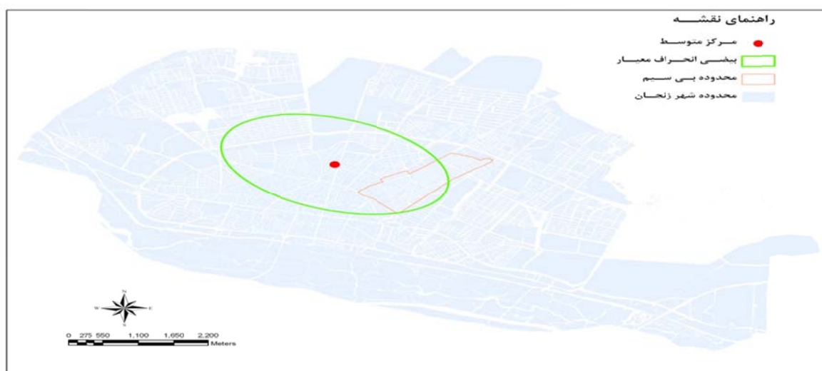
نقشه شماره ۲: مرکز متوسط و بیضی انحراف معیار کل جرایم در سطح شهر زنجان