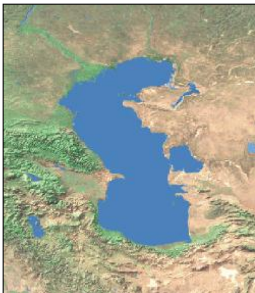
نقشه شماره ۱- موقعیت کلی دریای خزر

دریای خزر با وسعتی حدود ۴۳۸۰۰۰ کیلومترمربع بزرگ‌ترین دریاچه کره زمین به شمار می‌رود که از طریق رود «ولگا» و «ولگادن» به دریای سیاه و دریای بالتیک راه یافته و بنادر دریای خزر را به بنادر شمالی و جنوبی اروپا متصل می‌نماید. عمق این دریا از شمال به جنوب افزایش یافته بطوریکه عمق نواحی شمالی از ۱۶ متر تجاوز ننموده و در جنوب و جنوب غربی عمیق‌ترین نقطه آن به ۱۰۰۰ متر می‌رسد.