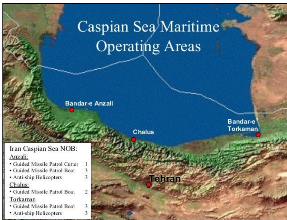
نقشه شماره ۲- مهم‌ترین بنادر فعال دریای خزر در سواحل ایران

سال‌های اخیر به دنبال استقلال جمهوری‌های حاشیه دریای خزر، موقعیت سیاسی و اقتصادی دریای خزر دگرگون گشت و در این میان ایران به‌عنوان نزدیک‌ترین راه ارتباطی این کشورها به دریای آزاد و قرار داشتن در مسیر کریدور شماره ۹ (شمال- جنوب) از اهمیت خاصی برخوردار گردید. حمل و نقل و جابجایی کالاها از طریق بنادر دریای خزر به اروپا در مقایسه با مسیر خلیج فارس به علت شرایط مساعد آب و هوایی، ارزانی نرخ حمل و نقل و کوتاه بودن مسیر کشتیرانی بسیار مناسب‌تر و مقرون به صرفه است.