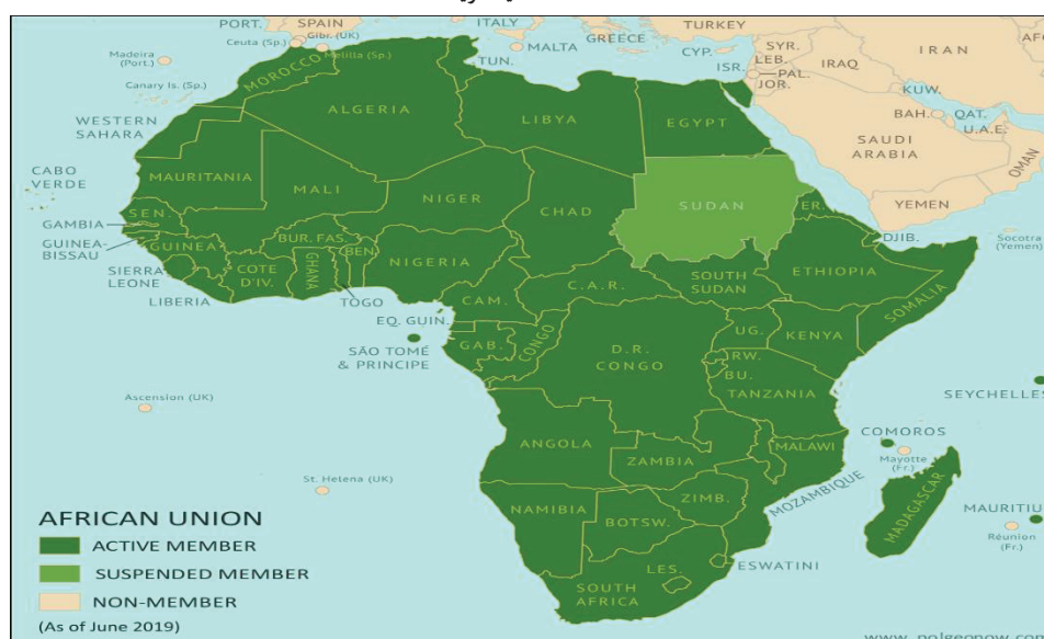
نقشه ۳: اتحادیه آفریقا