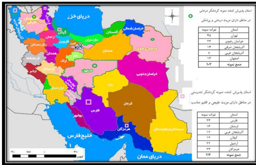
نقشه ۳: استان پذیرش کننده نمونه گردشگران خارجی تحقیق