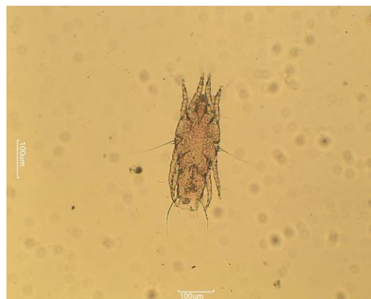
تصویر ۳_ جرب Megninia cubitalis

در این انگل بسیار آسان می‌باشد. حقایق فوق حاکی از این است که آلودگی به انگل‌های داخلی و خارجی مختلف می‌تواند بهای مخفی مهاجرت باشد (۱۱).