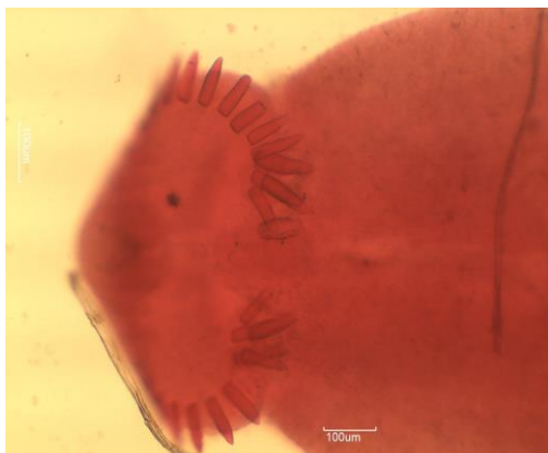
تصویر ۴_ ترماتید Echinostoma