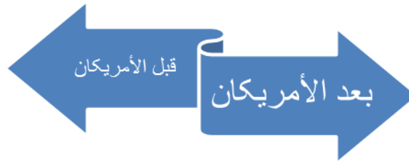
خط الزمن الروائي

المتأمل في بنية الشخصيات في رواية «مدن الملح» يرى أنّ هذه الرواية ليست مجالاً لخلق الشخصيات الفردية ومصيرها بل الكتاب يرنو من وراء هذه الشخصيات إلى ترسيم ملامح القوم العربي حيث تكونت الرواية من مشاهد عديدة، وفي كلّ مشهد يتعرف القارى على الشخصيات المتعددة لا سيّما عندما يروى الكاتب مصير العمال في شركة النفط التي أسّست في البلاد العربية؛ إنّ هذه الشخصيات ليست جوهرية ويكون عددها كبير حيث يصعب على الناقد تحليلها وفق الأسلوب القصصى المألوف عند النقاد وهذا لا يعنى أنّ رواية «مدن الملح» خالٍ من الشخصيات الفردية والمحورية وبتعبيرٍ آخر إنّ الشخصيات في هذه الرواية يمكن أن تكون مؤشرة دالة على المرحلة الاجتماعية التاريخية التي يعيشها الكاتب، ودالة على (مرشد، ٢٠٠٥: ٣٣). واقع يرسمه الكاتب في بداية الرواية بتوصيف ملامح قوم تغيّر شيئاً فشيئاً بدخول الأميركيان وهو مدقّ في ترسيم كل هذه التغييرات التي طرأت على العالم العربي كما أنّه منصف في توصيفه دون عصبية. تحاول هذه المقالة ترسيم خطوط أصلية لوجه الشخصية القومية للعرب إذ إنّ هذه الخطوط واللامح تتشكل شيئاً فشيئاً في الرواية بعقدة دخول الأميركيان في المنطقة العربية فينكسر الزمن الروائي إلى طورين: زمن قبل دخول الأميركيان وزمن بعد حضوره في المنطقة: