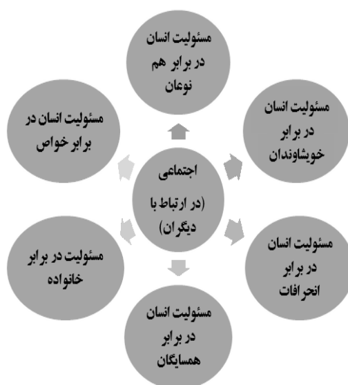
نمودار ۲-۴- اصول مولفه مسئولیت‌پذیری اجتماعی در اسلام

در مقاله حاضر تنها به توضیح چارچوب مفهومی بعد اجتماعی مسئولیت‌پذیری در سبک زندگی اسلامی پرداخته می‌شود که آن نیز اصولی را در بر می‌گیرد که در جدول (۲-۴) به آن‌ها اشاره شده است: