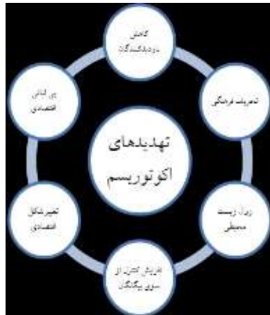
شکل ۲- تهدیدهای اکوتوریسم

فرصت‌ها و تهدیدهای ناشی از اکوتوریسم را نشان می‌دهند (۱۲).