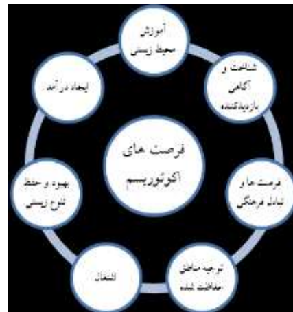
شکل ۱- فرصت‌های اکوتوریسم