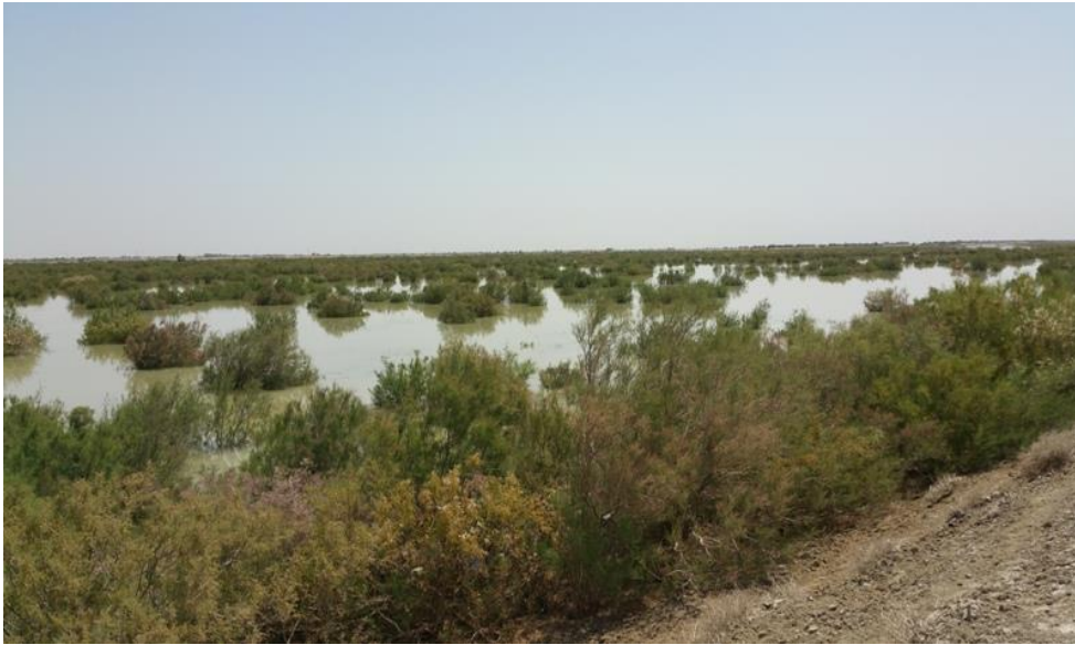
شکل ۳- نمونه‌ای از پوشش گیاهی دریاچه هامون مناسب ایجاد محیط گردشگری