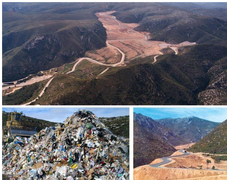
تصویر ۳- وضعیت دره ژوان قبل از احیا، ۲۰۰۰. دره ژوان، اسپانیا. (۶).

بوده اند که به طور کلی می توان به چالش های این طرح از قبیل کنترل شیرابه زباله، تولید گاز های گلخانه ای، حجم زیاد زباله، هدایت روان آب سطحی و از بین رفتن پوشش گیاهی بومی و حیوانات بومی اشاره کرد. و اهداف اصلی که کارفرما، شهرداری بارسلونا و سازمان های محیط زیستی، به دنبال برآورده کردن آن بودند و جزو سیاست های بالا دستی طرح محسوب می شوند عبارتند از (۷و۶):