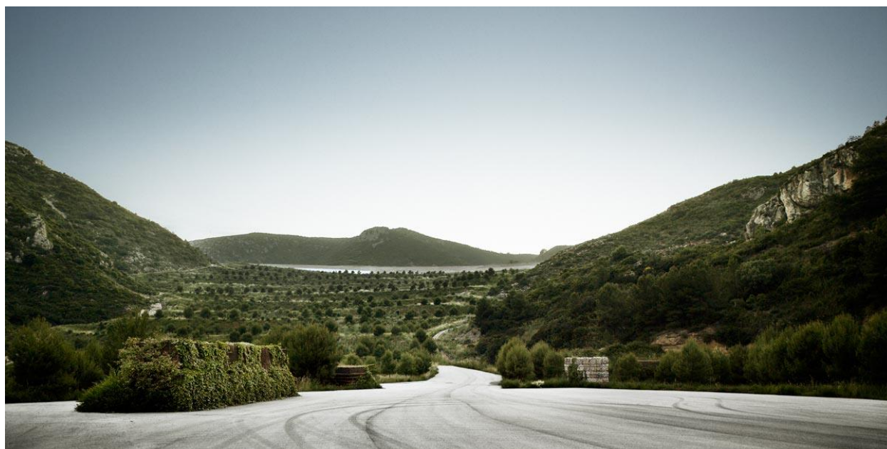
تصویر ۵- قرار دادن نمادین بسته های زباله در جاده قدیمی، ۲۰۰۹. دره ژوان، اسپانیا. (۴).