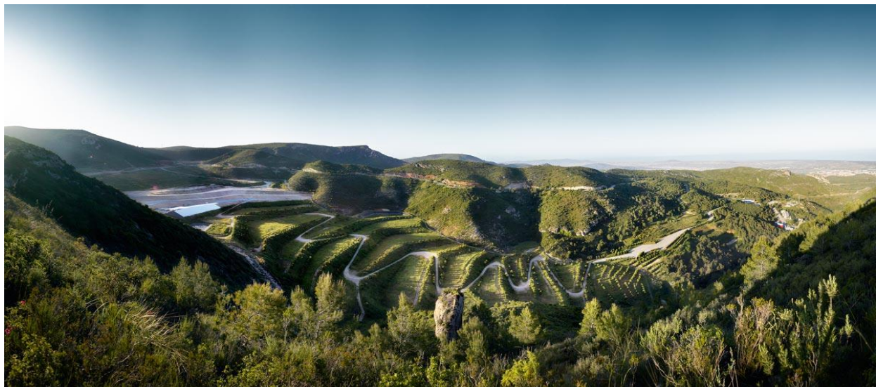
تصویر ۱- احیای لندفیل گاراف به عنوان ورودی پارک، ۲۰۰۹. دره ژوان، اسپانیا. (۶)

با توجه به معضلات عمده لندفیل ها برای شهر های امروز که شهر های ایران به طور جدی با این مشکل دست به گریبان هستند از مهمترین آنها می توان به لندفیل های حاشیه دریای خزر اشاره کرد که علاوه بر تخریب محیط زیست و بهداشت محیطی سبب بی هویتی مکان و از بین رفتن ماهیت ارگانیک فضا شده است. در صورتی که تنها به عنوان یک کمیت در نظر گرفته شود و جنبه های کیفی آن به عنوان عنصر فرعی و تزئینی قلمداد شود، به گسست تاریخی و فرهنگی در جامعه منجر میشود که اظهار نارضایتی گسترده از کیفیت معماری و شهرسازی تهران محصول آن است (۵). حال با توجه به این که بسیاری از کشور های پیشرفته جهان سال هاست فعالیت خود را در زمینه احیای این فضا های مرده آغاز کرده اند. می توان از تجربیات آنها در زمینه بهبود این فضا ها استفاده کرد. از پروژه های موفق در این زمینه پروژه لندفیل گاراف می باشد که در این نوشتار با معرفی این پروژه و تحلیل آن براساس اطلاعات بدست آمده از سایت شرکت طراح، مصاحبه با طراح و سایت های تحلیلی معماری انجام شده است و در نهایت به جمع بندی نقاط قوت و ضعف پروژه پرداخته شده است.