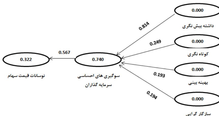
نمودار ۱ نتایج فرضیه سوگیری های احساسی سرمایه‌گذاران مؤثر بر نوسانات قیمت سهام در حالت معناداری