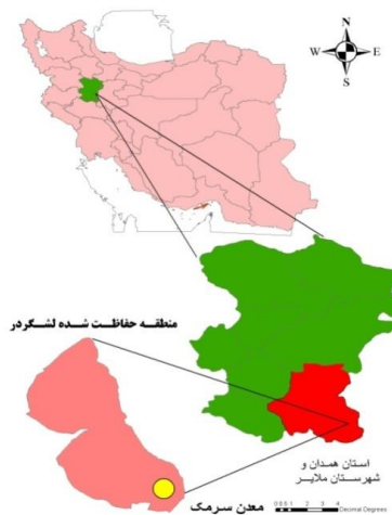
شکل ۱- نقشه موقعیت جغرافیایی معدن آهنگران نسبت به منطقه حفاظت شده لشگردر، شهرستان ملایر، استان همدان و کشور

و پوست تخم خود برخی از فلزات را دفع می کنند، به عنوان مثال پرندگان دریایی فلزات را در غلظت هایی چند برابر میزان موجود در آب، انباشت کرده و سبب بزرگ نمایی زیستی در موجودات می گردند (۱۳). لذا آلوده شدن آن ها قادر است بیماری ها و یا فلزات سمی را به مردمی که از آن ها مصرف می کند انتقال دهد (۱۴). پرندگان می توانند سطوح بالایی از فلزات را درون بافت های خود از جمله کبد و کلیه و پر نگهداری کنند (۱۵ و ۱۶). کادمیوم عنصری فلزی و نرم به رنگ سفید مایل به آبی است که در مجاورت هوا تیره می شود. کادمیوم مانند سرب یک عنصر غیر ضروری است و به دلیل سمیت بالا و پایداری آن در غذا و در محیط زیست به عنوان یکی از خطرناکترین فلزات سنگین توصیف شده و ممکن است اثرات شدیدی بر موجودات زنده (میکروارگانیزمها، گیاهان و جانوران) داشته باشد. غلظت بالای کادمیوم در پر به شدت با کاهش نرخ رشد استخوان در ارتباط است (۱۷). اثرات سمی کادمیوم در پرندگان شامل کاهش تولید تخم، آسیب کلیوی، آسیب به بیضه و تغییر واکنش رفتاری است (۱۸). بنابراین می توان نتیجه گیری نمود که تجمع فلزات در بافت های پرندگان بیشتر از محیط اطراف است هر چند که اثرات جغرافیایی را نمی توان نادیده گرفت (۱۹). در این بررسی، گونه کبک