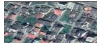
شکل ۴- موقعیت شهرک کاج، کریم آباد و آرامش