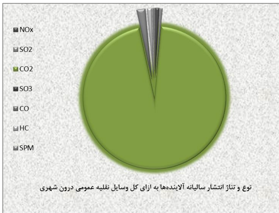
نمودار ۱- نوع و تناژ انتشار سالیانه آلاینده‌ها به ازای کل وسایل نقلیه عمومی درون شهری شهرستان یزد در سال ۱۳۸۹ Figure 1. type and tonnage for the total annual emissions of pollutants per total Public transport vehicles in the city of Yazd in 2010

است. از این نمودار می‌توان نتیجه گرفت که بعد از آلاینده دی اکسید کربن (CO 2 )، به ترتیب آلاینده‌های مونوکسیدکربن (CO)، کربن هیدرات (HC)، اکسید نیتروژن (NOx)، دی اکسید گوگرد (SO 2 )، ذرات معلق (SPM) و تری اکسید گوگرد (SO 3 ) سهم بیشتری را در سال ۱۳۸۹ از کل آلاینده‌های انتشار یافته داشته‌اند.