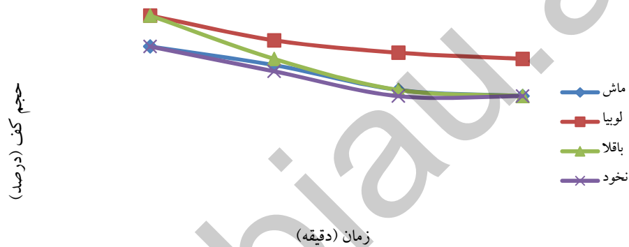
نمودار ۲- پایداری کف حاصل از حبوبات بر حسب درصد در زمان‌های ۰، ۳۰، ۶۰، ۹۰ و ۱۲۰ دقیقه.

در نقطه ایزوالکتریک به علت کاهش واکنش‌های دافعه بین مولکول‌ها، سرعت تشکیل یک لایه ویسکوز در بین دو