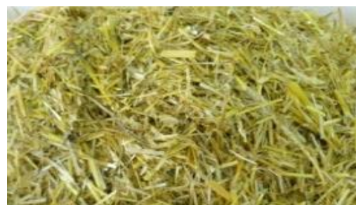
کاه و کلش گندم