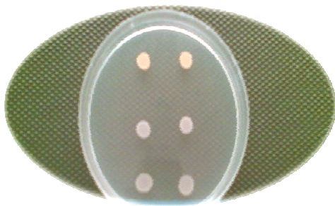
شکل ۲- نمونه دارای اتانول، همانطور که پیداست، میکروب‌ها در محیط حاوی الکل کاملاً رشد کرده‌اند

ترکیب تفسیر و ترکیبات عمده تشکیل دهنده اسانس شناسایی شدند. شکل ۱ کروماتوگرام حاصل از GC-MS می‌باشد. جدول ۲ ترکیبات موجود در اسانس گیاه نعناع فلفلی و مقدار آنها در اسانس را نشان می‌دهد. جدول ۳ نشان دهنده وجود اثر ضد میکروبی یا بی اثر بودن اسانس در غلظت‌های مختلف بر روی میکروارگانیسم‌های مذکور می‌باشد. شکل ۲ نیز مبین آن است که اتانول ۹۶ درجه که به محیط اضافه شده، نتوانسته از رشد میکروب‌ها جلوگیری کند.