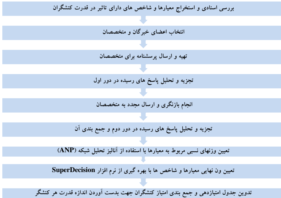
شکل ۱: مراحل انجام پژوهش

ارسالی توسط خبرگان و بررسی نظرات آنها و با توجه به درصد پاسخ‌گویی، ۳ معیار و ۱ شاخص انتخاب شدند معیارهای اندازه‌گیری قدرت کنشگران تأثیرگذار در تولید فضای شهری به شرح ذیل حاصل گردید که توضیح مختصری در مورد هر معیار در اینجا ارائه می‌گردد.