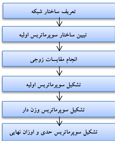
شکل ۲: مراحل پیاده‌سازی ANP

وزن‌هایی است که در مرحله ۲ از مقایسات زوجی حاصل شد؛ (۵) ایجاد سوپر ماتریس موزون: بعد از ایجاد سوپر ماتریس اولیه، سوپر ماتریس موزون ایجاد گردید؛ (۶) ایجاد سوپر ماتریس حدی: سوپر ماتریس موزون را باید به توان بی‌نهایت رساند تا هر سطر آن به عددی همگرا شود. و آن عدد وزن آن معیار یا زیرمعیار و یا گزینه است. برای تحلیل ANP از نرم‌افزار سوپردسیژن (Super decision) که از نرم‌افزارهای معروف در زمینه تصمیم‌گیری چند معیاره است که به حل مدل‌های AHP و ANP می‌پردازد، استفاده شد. مراحل پیاده‌سازی ANP به صورت خلاصه در شکل (۱) آورده شده است. در این پژوهش، نرخ ناسازگاری در تمام ماتریس‌ها، کمتر از ۰،۱ بود. از این رو، ماتریس‌ها سازگار هستند.