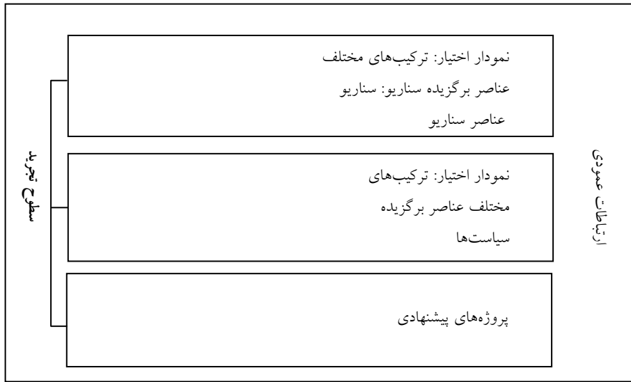
نمودار شماره (۱): ساختار روش در سه سطح تجریدی