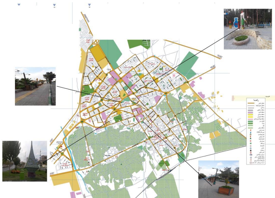
شکل ۲: نمونه‌هایی از نمادهای شهری، در شهر سمنان، نگارنده، ۱۳۹۹