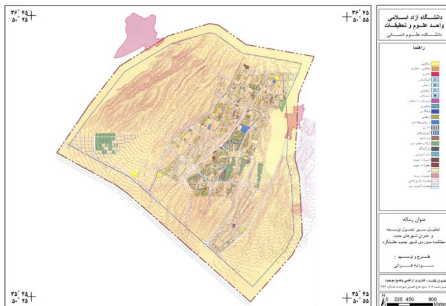
شکل شماره ۲: نقشه کاربری وضع موجود شهر جدید هشتگرد