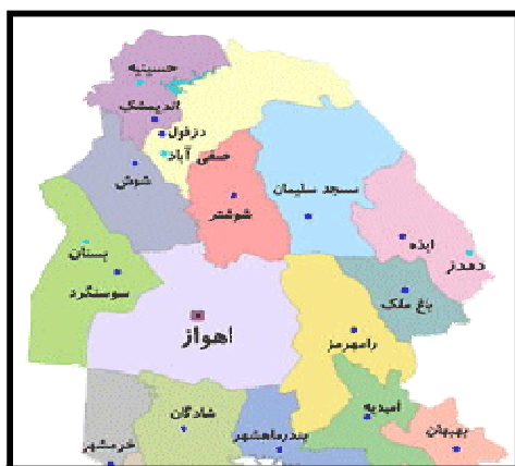
شکل ۲: نقشه مقعیت قرار گیری شهرستان اهواز بر گستره استان خوزستان منبع: دفتر اجرایی بافت فرسوده اهواز ۱۳۸۵