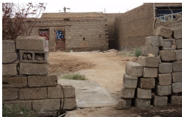
شکل ۷: نوع مصالح ساختمانی بکار رفته در منطقه