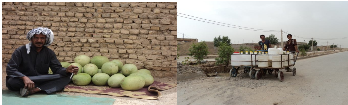
شکل ۵ و ۶: اشتغال در کوی سیاحی