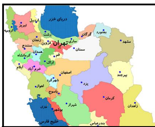
شکل ۱: نقشه موقعیت قرارگیری استان خوزستان بر گستره ایران