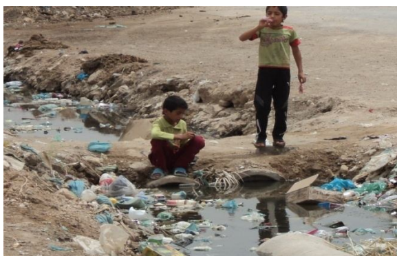
شکل ۸: نحوه دفع فاضلاب در منطقه