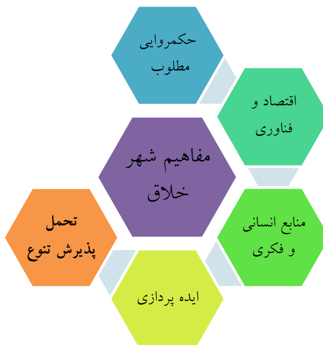
مدل مفهومی تحقیق