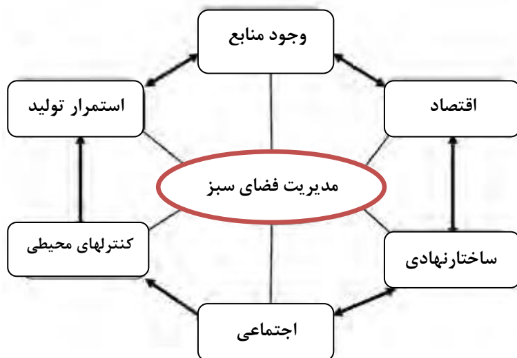
شکل (۲): الگو و چارچوب فرایند مدیریت توسعه پایدار در فضای سبز شهری

- مدیریت استراتژی: چارچوبی است که مجموعه حرکات و اقدامات اصلی را برای دستیابی به اهداف ترسیم کرده و چگونگی تخصیص کلی منابع را برای بدست آوردن موقعیت‌های مطلوب، خنثی کردن تهدیدها در حال و آینده بیان می‌دارد. همچنین مدیریت استراتژی به عنوان طرح و نقشه الگو موضع و دیدگاه به کار می‌رود (شکل ۲). بدین ترتیب راهبرد تدابیری است که در جامعه برای کاربرد کلیه منابع موجود و قابل حصول به منظور حفظ ارزش‌های متعلق به خود اتخاذ می‌شود (رضوانی، ۱۳۸۹: ۱۱۶).