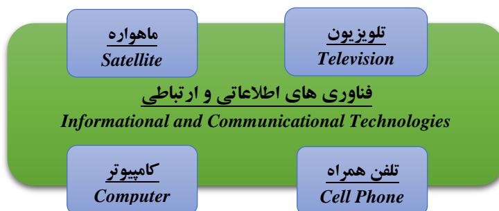
شکل ۱: فناوری‌های اطلاعاتی و ارتباطی