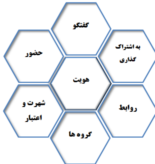
شکل (۱): هفت عملکرد رسانه‌های اجتماعی (منبع: Kietzmann, J., & Angell, ۲۰۱۰)

هفت عملکرد برای رسانه‌های اجتماعی در نظر گرفته می‌شود، هویت ۱۸ ، گفتگو، درمیان‌گذاری، حضور، روابط، اعتبار، و گروه. این ویژگی‌ها به ما اجازه می‌دهند که سطوح مختلفی از قابلیت‌های رسانه‌ای که می‌توانند پیکربندی شوند را درک کنیم. این بلوک‌های ساختمانی نه انحصار دوطرفه دارند و نه همه آنها باید در فعالیت رسانه‌های اجتماعی حضور داشته باشند، آنها ساختارهای اصلی رسانه‌های اجتماعی هستند.