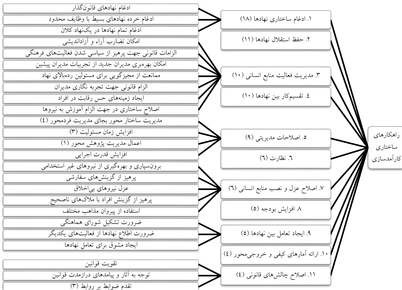
نمودار ۲- راهکارهای ساختاری کارآمد سازی نهادهای دینی