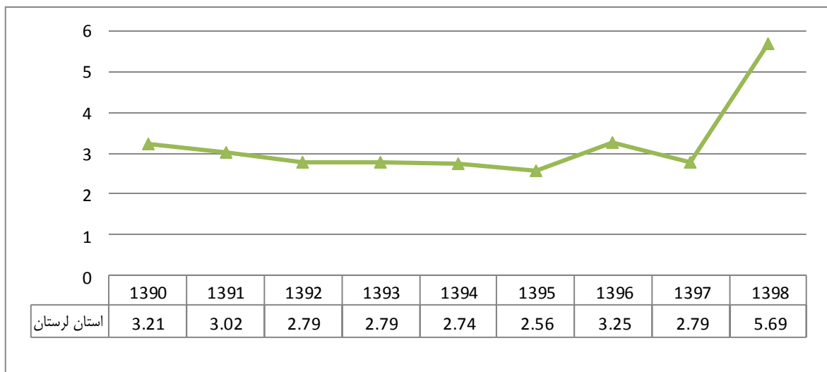
نمودار ۱ - میانگین تعداد دندانپزشکان به ازای صد هزار جمعیت در استان لرستان