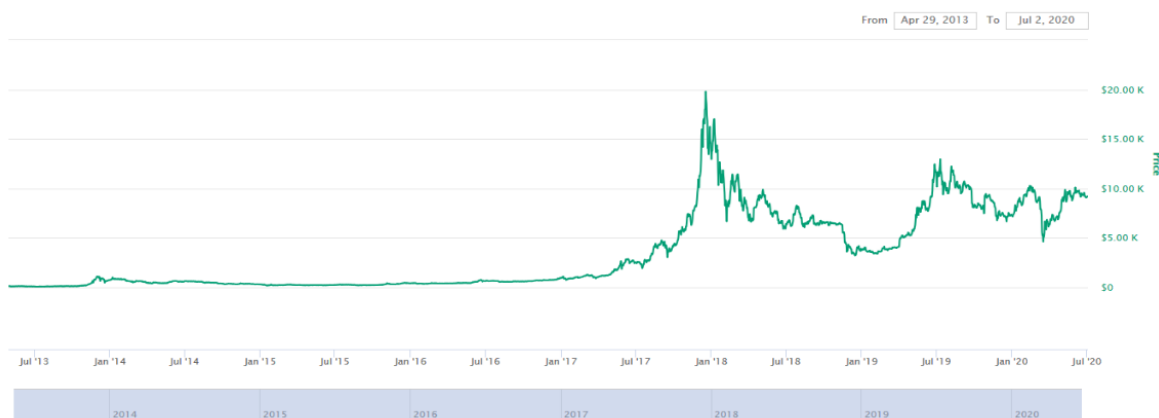
شکل ۱- نمودار تغییرات قیمت بیت‌کوین از آوریل ۲۰۱۳ تا جولای ۲۰۲۰

مجموعه داده مربوط به بیت‌کوین از آوریل ۲۰۱۳ تا جولای ۲۰۲۰ بسط داده شد که توزیع قیمت بسته شدن