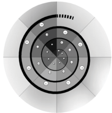
شکل ۲. فرآیند تهیه طرح های ساختاری - راهبردی، تفصیلی پایه، موضعی و موضوعی شهرها

کشور در فاصله سال های ۱۳۶۹ تا ۱۳۷۹ شامل تهیه طرح های توسعه و عمران شهرستان و طرح های ساختاری - راهبردی شهر و طرح های تفصیلی موضعی و موضوعی، به نظر می رسد با تهیه و اجرای طرح های مذکور، راه حل هایی برای مقابله با چالش های موجود در شهرسازی کشور قابل حصول بوده و چشم انداز بهتری برای آینده شهرسازی ایران در این که در زیر به آن ها اشاره شده است، موارد قابل پیش بینی است.