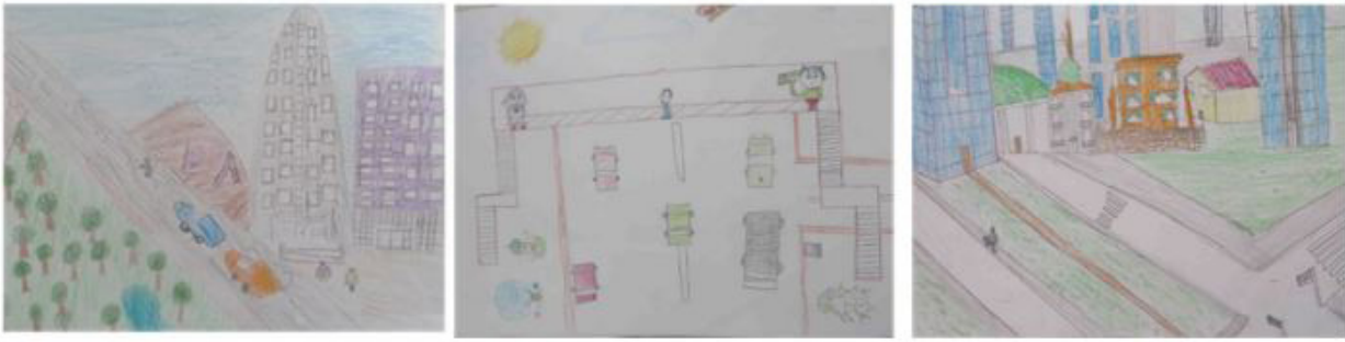
شکل ۲. عناصر کالبدی و ابزار در نقاشی کودکان