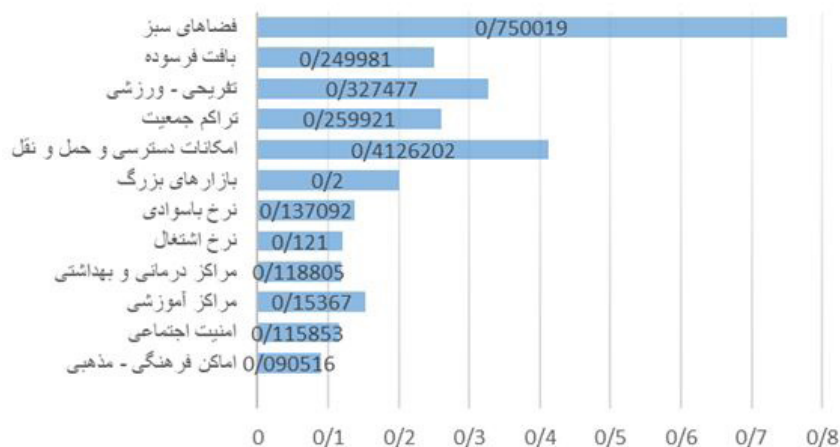
شکل ۲. نمودار اطلاعات نرخ ناسازگاری

و بالاخره مسئله درآمد برای همه آحاد شهر اشاره کرد. گونه شناسی آسیب‌های محلات منطقه یک که با استفاده از روش کتابخانه‌ای و مشاهده میدانی از نقطه-محل‌های مختلف نشان می‌دهد که در کل آسیب‌های اجتماعی به سه نوع اصلی تکدی‌گری، معتادان خیابانی و کارگران فصلی تقسیم می‌شوند. تکدی‌گری در نواحی ۱، ۲، ۳، ۷ و ۸ دیده می‌شود در نواحی مذکور نرخ بالای جمعیت و آمدوشدها و همچنین نزدیکی به مراکز تجاری و خرید از عوامل بروز این آسیب تشخیص داده شده است که اکثر تکدی‌گران این نقاط از شهروندان روستاهای حاشیه جنوبی شهر تهران و نواحی جنوبی آن واقع در مناطق حاشیه‌نشین و زاغه‌نشین است.