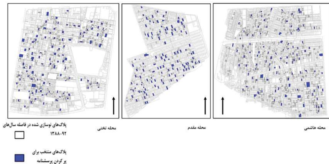
شکل ۳. موقعیت توزیع پرسش‌نامه‌ها در محلات

مسکونی، محله و رضایتمندی کلی سکونتی استفاده شد.