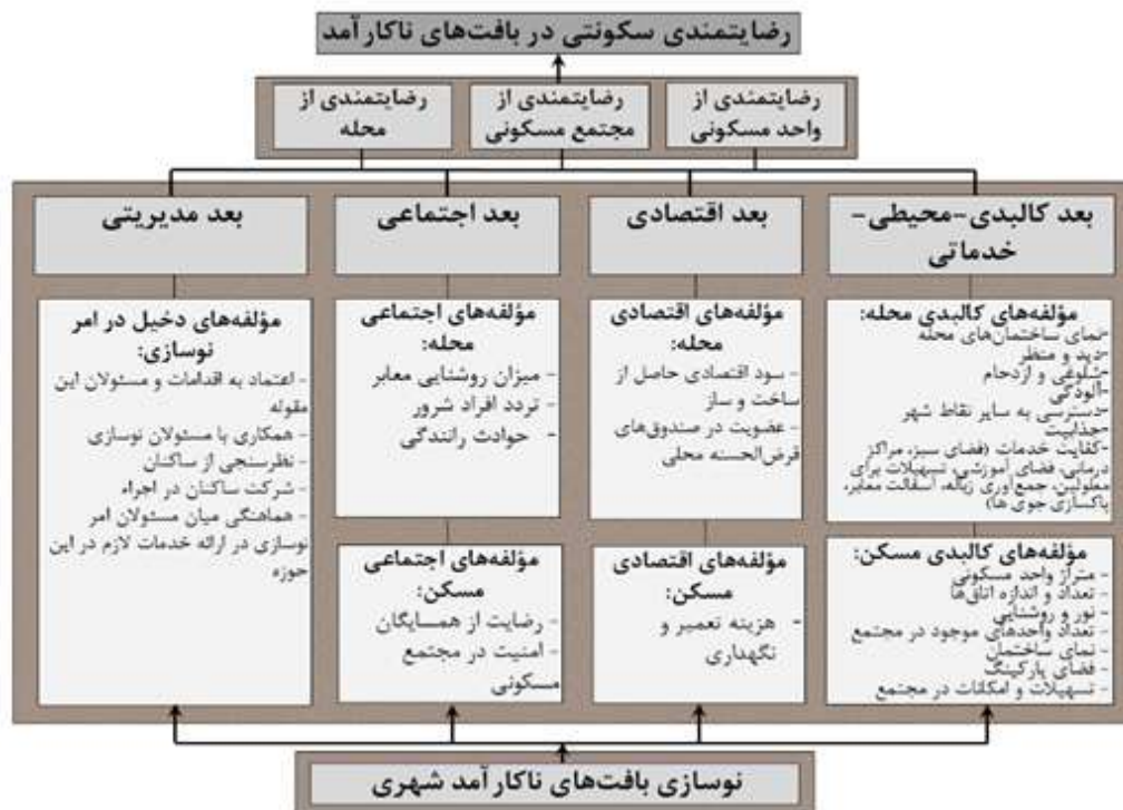
شکل ۲. مدل عملیاتی انجام پژوهش