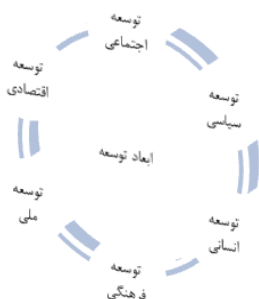
شکل ۱ - معرفی ابعاد توسعه