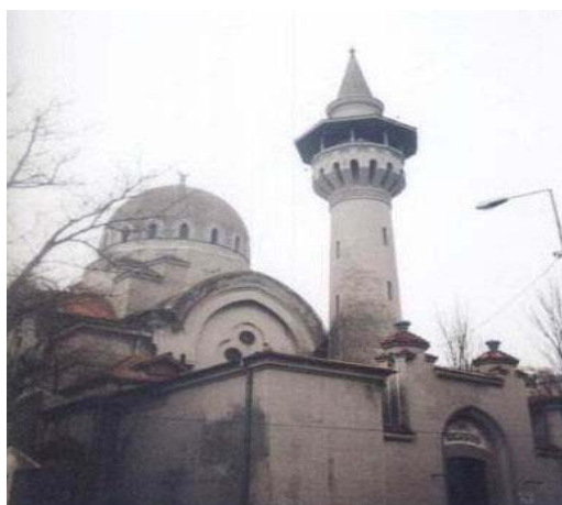
مسجد بزرگ شهر کنستانتینوپل بین سالهای 1910-1912م توسط بنای رومانی کاروان اول ساخته شد. در همین مکان یک مسجد قدیمی بود که در اواسط قرن 18 میلادی سلطان عثمانی محمود اول ساخته شد.

به دابروجا اعزام می‌شدند، دابروجا را ترک کردند. این موضوع را نباید مرتبط با مسأله مذهب دانست، زیرا مسیحیان دابروجا نیز از این فشار در امان نبودند و عده‌ای از آنان نیز به همین خاطر، مجبور شدند تا به عثمانی مهاجرت کنند. ۵ به هر حال، باید گفت که به رغم این مهاجرتها، مسلمانانی که تصمیم به مهاجرت از دابروجا گرفتند، در مقایسه با مسلمانانی که ترجیح دادند در آنجا بمانند، در اقلیت بودند.