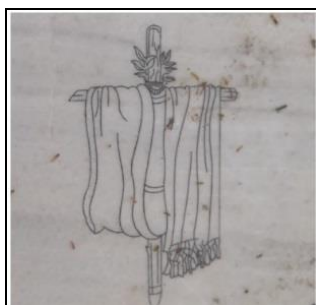
تصویر شماره ۱۳: درفش مندایی بر روی سنگ قبر.