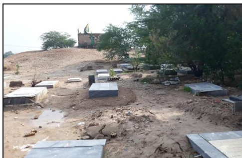
تصویر شماره ۷: نمایی از آرامستان چنیه.

آرامستان لهستانی‌ها و کلدانی - آشوری‌ها: این آرامستان در منطقه ۷ شهر اهواز، در امتداد بلوار نواب صفوی، در میدان تره‌بار قدیم این شهر و در مجاورت آرامستان ارامنه واقع شده است. بنا به گفته کشیش کلیسای کلدانی، از زمان ساخت آرامستان کلدانی - آشوری بیش از یک قرن می‌گذرد. اولین قبر کلدانی - آشوری موجود، به سال ۱۲۶۸ هـ. برمی - گردد و روش تدفین طبق آیین مسیحیت است. سال‌های بعد در زمان جنگ جهانی دوم در که تبعیدیان لهستانی آزاد شدند، شمار زیادی از آنان در طی گذر از ایران به علت کهولت سن و بیماری درگذشتند و در این خاک دفن شدند. شمار بسیاری هم مقیم ایران شدند. از