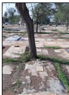
تصویر شماره ۱۶: نمایی از آرامستان قدیمی مسلمانان.