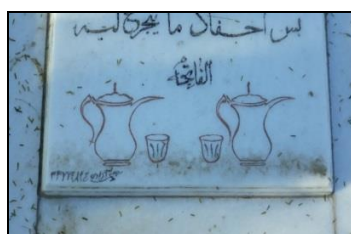
تصویر شماره ۲۰: نشانه به‌کار رفته بر سنگ‌مزار آرامستان شهدای زرگان.

آرامستان سیدخلف: آرامستان شهدای سیدخلف در شمال شهر اهواز و در محله سیدخلف قرار دارد. این آرامستان فقط به متوفیان ساکنان این محله تعلق دارد. ساکنین این محله نیز غالباً عرب‌زبانند و اشعار و متون عربی بر روی سنگ‌مزارها به چشم می‌خورد. تاریخ شکل‌گیری آن بر اساس مطالعات میدانی به سال ۱۳۴۰ش بازمی‌گردد و مرمتی در آن صورت نگرفته است. نام این آرامستان بر اساس نام محله‌ای که در آن واقع شده و با توجه به این‌که پیکر چند تن از شهدای دفاع مقدس در آنجا آرمیده، انتخاب شده است. جهت قبور در این مکان مطابق با آیین اسلامی است. از عناصر کالبدی این آرامستان می‌توان به وجود دیوار، حصار و درب ورودی و همچنین اتاقک‌های تدفینی خانوادگی با پلان‌های مربع و حجم‌های مکعب فاقد گنبد، یک بقعه دارای گنبد مختص به مقبره یکی از بزرگان این محل، سایبان‌های فلزی برای چند قبر و یادمان‌های مقابر شهدا اشاره کرد. این محل فاقد غسل‌خانه است. تراکم قبور در بخش‌های متأخر را می‌توان نیمه‌متراکم و در بخش اولیه پراکنده خواند. پوشش سطح بیشتر قبرها از سنگ مرمر است و به‌ندرت از سیمان یا موزاییک