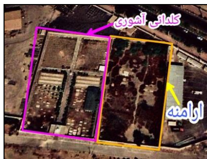
تصویر شماره ۸: تصویر هوایی آرامستان کلدانی-آشوری‌ها.

بر اساس مطالعات انجام شده از طرف دولت لهستان شمار قبور به ۹۵ می‌رسد و براساس مطالعات میدانی و بررسی سنگ‌مزارهای خوانا اولین قبر لهستانی موجود در این محل مربوط به سال ۱۳۲۱ ش است. در این آرامستان، سنگ‌مزارها از جنس مرمر بوده و نقش‌های به کار رفته بر آن‌ها شامل عکس و مشخصات متوفی، نوشته‌های ادبی و مذهبی به خط فارسی و آرامی و صلیب است. سازه‌های کنار برخی قبور شامل گلدان‌های سنگی، مجسمه سنگی، سنگ برافراشته، سایبان و بادمان لهستانی‌هاست. محوطه داخلی، سنگ‌فرش مسیر عبور، برخی سنگ‌مزارها و گنبدخانه ورودی این آرامستان در سال ۱۳۹۵ ش مرمت شد.