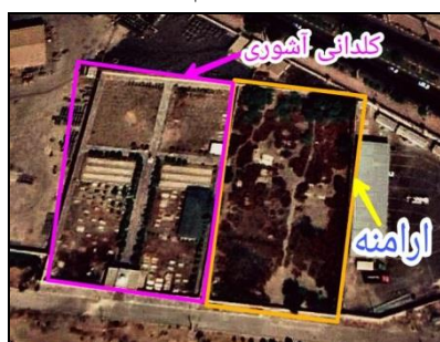
تصویر شماره ۱۰: تصویر هوایی آرامستان ارامنه.

آرامستان ارامنه: آرامستان ارامنه این آرامستان در منطقه ۷ شهر اهواز، در امتداد بلوار نواب صفوی، در میدان تره‌بار قدیم این شهر و در مجاورت آرامستان آشوری_کلدانی‌ها واقع شده‌است. تاریخ شکل‌گیری آن بر اساس مطالعات میدانی و سنگ‌قبرهای خوانا به سال ۱۲۸۷ هـ. بازمی‌گردد. از سازه‌های این آرامستان می‌توان از دیوار پیرامونی، یادمان شهدا، صلیب‌های سنگی برافراشته، مجمرهای سنگی، قبرهای صندوقچه‌ای، محرابی و پلکانی نام برد. جنس سنگ‌مزارها غالباً سنگ تیشه‌ای است که نام و مشخصات متوفی و هم‌چنین نوشته‌هایی به زبان ارمنی و فارسی، صلیب، نقوش گیاهان، ابزارآلات بر روی آن‌ها حجاری شده‌است. روش تدفین طبق آیین مسیحیت انجام می‌شود.