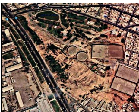
تصویر شماره ۳: تصویر هوایی تپه باستانی کوهساران.

استودان، قبر و دیگر سازه‌های تاریخی و متعلق به دوره اشکانیان اند» ۲۰ در دوره اشکانیان این نوع قبور رواج داشته، اما روش تدفین در آن‌ها در سرزمین‌های مختلف یکسان نبوده است. این تپه سنگی و صخره‌ای است و در محوطه گورها فاقد پوشش گیاهی می‌باشد. به علت ساخت‌وساز دو منبع آب بزرگ شهری، اتوبان و پارک، بخش اعظم این تپه دست‌خوش تغییر شده و روی به نابودی گذاشته است.