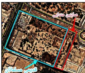
تصویر شماره ۱۵: تصویر هوایی آرامستان قدیمی مسلمانان.

سپرده شده‌اند و پوشش روی مقبره آن‌ها شبیه یکدیگر، هم‌جنس و هم‌رنگ است. تراکم قبور در بخش‌های متأخر را می‌توان نیمه‌متراکم و در بخش اولیه پراکنده خواند. پوشش سطح بیشتر قبرها از سنگ مرمر و سنگ تیشه‌ای است و برخی موارد از سیمان، موزاییک و کاشی استفاده شده‌است. سنگ‌مزارها علاوه بر داشتن نام و مشخصات متوفی، مزین به نشانه‌هایی شامل ابزار، اشعار، تصویر یا اسامی امامان معصوم، آیات قرآنی، نقوشی از گیاهان و حیوانات و هم‌چنین آرایه‌های نمادین مانند کتاب، فرشته، شمع و خورشیدند. امروزه تدفین در این محل صرفاً برای مالکین قبور امکان‌پذیر است.