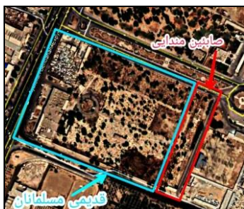
تصویر شماره ۱۲: تصویر هوایی آرامستان صابین.

ورودی، سایبان فلزی جهت انجام مراسمات مذهبی، گورهای خانوادگی روباز و نمادهای مقابر شهدا اشاره کرد. قبور به صورت منفرد با تراکم کم ساخته شده‌اند. پوشش سطح بیشتر قبرها از سنگ مرمر است و به ندرت از سیمان استفاده شده است. برخی قبور نیز فاقد پوشش مستحکم و کاملاً گلی‌اند در آیین مندایی هر شخص در بدو تولد علاوه بر نام شناسنامه‌ای خود یک نام دینی ۳۰ دارد. بر بیشتر سنگ‌مزارها ملواشه متوفی هم در کنار نام شناسنامه‌ای وی نوشته شده است. سنگ قبور به درفش مندایی ۳۱ و بوته‌هایی ۳۲ از کتاب مقدس گنزار ۳۳ با و برخی علاوه بر آن به نشانه‌هایی شامل اشعار، نقوشی از گیاهان و حیوانات و هم‌چنین آرایه‌های نمادین مانند کتاب، شمع و خورشید مزین شده‌اند. نوشته‌های برخی از این سنگ‌مزارها به خط فارسی و برخی به خط مندایی است. بنا به قوانین کشوری در این محل تدفین انجام نمی‌شود و آرامستان جدید آن‌ها خارج از شهر در جاده برومی در نزدیکی آرامستان جدید مسلمانان قرار گرفته است.