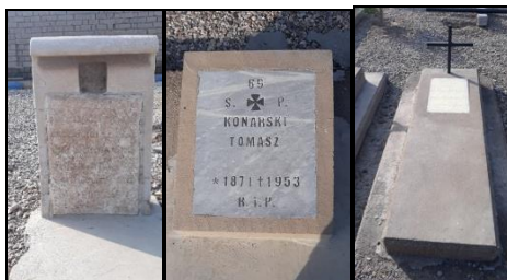
تصویر شماره ۹: قبور آرامستان کلدانی_آشوری‌ها.

آرامستان ارامنه: آرامستان ارامنه این آرامستان در منطقه ۷ شهر اهواز، در امتداد بلوار نواب صفوی، در میدان تره‌بار قدیم این شهر و در مجاورت آرامستان آشوری_کلدانی‌ها واقع شده‌است. تاریخ شکل‌گیری آن بر اساس مطالعات میدانی و سنگ‌قبرهای خوانا به سال ۱۲۸۷ هـ. بازمی‌گردد. از سازه‌های این آرامستان می‌توان از دیوار پیرامونی، یادمان شهدا، صلیب‌های سنگی برافراشته، مجمرهای سنگی، قبرهای صندوقچه‌ای، محرابی و پلکانی نام برد. جنس سنگ‌مزارها غالباً سنگ تیشه‌ای است که نام و مشخصات متوفی و هم‌چنین نوشته‌هایی به زبان ارمنی و فارسی، صلیب، نقوش گیاهان، ابزارآلات بر روی آن‌ها حجاری شده‌است. روش تدفین طبق آیین مسیحیت انجام می‌شود.