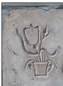
تصویر شماره ۲۳: نشانه به‌کار رفته بر سنگ‌مزار آرامستان سیدخلف.