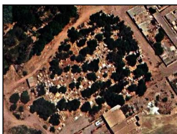
تصویر شماره ۱۸: تصویر هوایی آرامستان شهدای زرگان.

آرامستان گلزار شهدای زرگان: آرامستان گلزار شهدای زرگان واقع در شمال شرق شهر اهواز و در محله زرگان در نزدیکی رود کارون قرار دارد و در واقع یک آرامستان محلی است. از آنجا که ساکنان این محله عرب زبان اند متن و اشعار روی برخی از سنگ مزارها به زبان عربی است. تاریخ شکل گیری آن بر اساس مطالعات میدانی به سال ۱۳۴۳ ش بازمی گردد. این آرامستان بر اساس نام محله ای که در آن واقع شده و با توجه به این که پیکر پاک چند تن از شهدای دفاع مقدس در آنجا آرمیده نام گذاری گردیده است. جهت قبور در این مکان مطابق با آیین اسلامی است. از عناصر کالبدی این آرامستان می توان به وجود اتاقک های تدفینی خانوادگی با پلان های مربع و حجم های مکعب فاقد گنبد، یک نشان با طرح آلاچیق و دارای گنبد مختص به یک مقبره، هم چنین گورهای خانوادگی روباز و نشان های مقابر شهدا اشاره کرد. هم چنین این محل فاقد غسل خانه و دیوار و درب است. قبور در بخش های متأخر نسبتا متراکم اند و در بخش اولیه پراکنده. پوشش بیشتر قبرها از سنگ مرمر است و به ندرت از سیمان یا موزاییک استفاده شده است و گاه برخی قبور فاقد پوشش مستحکم اند و کاملا گلی اند. سنگ مزارها علاوه بر داشتن نام و مشخصات متوفی، مزین به نشانه هایی شامل ابزار، اشعار، تصویر و یا نام های امامان معصوم، آیات قرآنی، نقوشی از گیاهان و حیوانات و هم چنین آرایه های نمادین مانند کتاب، ظروف، شمع و خورشیدند. هنوز هم در این محل مردگان را به خاک می سپارند.