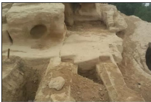
تصویر شماره ۴: گوردخمه اشکانی، تپه کوهساران.