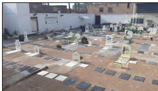
تصویر شماره ۲: نمایی از آرامستان حرم علی بن مهزیار اهوازی.

گورهای تپه باستانی کوهساران: در منطقه ۷ شهر اهواز و در ابتدای محله منبع آب، بقایای این تپه باستانی به چشم می خورد. شهر هرمز اردشیر که پایه ها و ستون های شهر جدید اهواز بر ویرانه های آن بنا شده است و پیشینه پرشکوه تمدن این منطقه محسوب می شود به گواهی اسناد و مدارک دست کم تا ۶۰ یا ۷۰ سال پیش بقایا و آثار آن برای همگان قابل مشاهده بود و از همین رو در سال ۱۳۱۰ ش به ثبت ملی رسیده بوده است. ۱۹ بقایای شماری از گورهای به جامانده از این شهر باستانی در محله منبع آب، در پارک کوهساران هنوز موجود است. سخنگوی انجمن دوست داران میراث فرهنگی استان خوزستان در گفتگویی با خبرگزاری مهر گفت: «آثار به جای مانده بر این تپه باستانی از نوع گوردخمه،