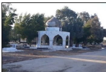
تصویر شماره ۱۹: نمایی از آرامستان شهدای زرگان.