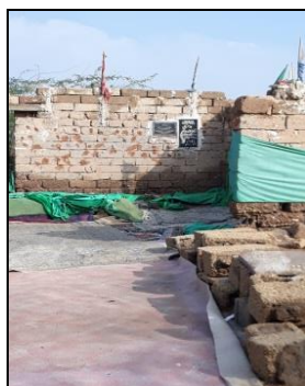
تصویر شماره ۶: اتاقک روباز آرامستان چنیه.