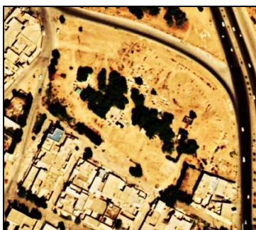
تصویر شماره ۵: تصویر هوایی آرامستان تپه باستانی چنّیبه.

آرامستان تپه باستانی چنّیبه: این تپه باستانی در جنوب غرب اهواز واقع است. بنا به گفته دکتر علی بحرانی‌پور، نام اصلی این تپه با توجه به تحقیقات کارتر ۲۱ و فرانک هول ۲۲ «چغاهفت پیران» است و به استناد شواهد سفال‌شناختی، سابقه آن به عهد ایلامیان برمی‌گردد. ۲۳ زبان غالب محلیان چنّیبه عربی است و آرامستانی را که در این محل بنا نموده‌اند، آرامستان «سبعه» می‌خوانند. سبعه که در زبان عربی معادل عدد هفت است اشاره به نام اصلی تپه دارد. این تپه تنها محوطه شناخته‌شده پیش از هخامنشی در جنوب اهواز است. ۲۴ بر اساس مطالعات میدانی و بررسی سنگ‌مزارهای خوانا اولین قبر در سال ۱۳۵۰ش در این محل ساخته شده است. روش تدفین در این مکان طبق آیین اسلامی است و قبرها به صورت پراکنده و بدون طرح بنا شده‌اند و غالباً پوشش آن‌ها سنگ مرمر است و برخی نیز فاقد پوشش مستحکم کاملاً گلی‌اند. تنها بنای ساخته‌شده در این آرامستان اتاقکی روباز است که به جهت انجام اعمال مذهبی ساخته شده است.