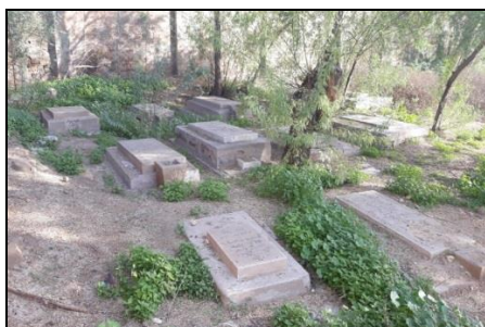
تصویر شماره ۱۱: نمایی از آرامستان ارامنه.

آرامستان گلزار شهدای صابئین مندایی ایران: این آرامستان که مختص به اقلیت مذهبی صابئین مندایی است در جنوب شرق شهر اهواز، در محله مهدیس قرار دارد. این قطعه ابتدا بخشی از آرامستان قدیمی مسلمانان بوده که در اختیار این اقلیت قرار داده شده است و بعدها توسط دیوار کوتاهی از یکدیگر جدا شده‌اند. احداث این دیوار باعث ویرانی و از بین رفتن شماری از قبور منداییان گردید. تاریخ شکل‌گیری آن بر اساس بررسی‌های میدانی و مطالعه سنگ‌قبرهای خوانای قبور باقی مانده به سال ۱۳۴۴ش بازمی‌گردد و بر طبق گفته رابط انجمن منداییان ۲۷ تاریخ تأسیس این آرامستان سال ۱۳۴۰ش است و هیچ دوره مرمت و توسعه‌ای نداشته‌است. نام این آرامستان مقتبس از نام آیین صابئین و نیز دفن شماری از شهدای مندایی جنگ عراق با ایران است. جهت قبور در این مکان بر طبق آیین منداییت در جهت شمالی-جنوبی است به طوری که پیکر متوفی را بر پشت می‌خوابانند، پاها را به سمت شمال و سر را به سمت جنوب قرار می‌دهند و سر و صورت وی را در لحد ۲۸ می‌گذارند. ۲۹ از عناصر معماری این آرامستان می‌توان به وجود دیوار، حصار، درب