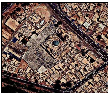
تصویر شماره ۱: تصویر هوایی مجموعه حرم علی بن مهزیار اهوازی.