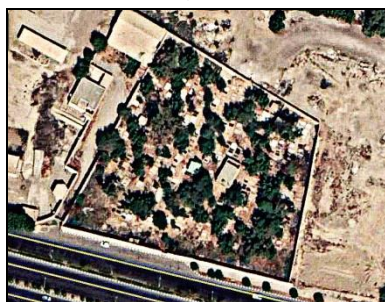
تصویر شماره ۲۱: تصویر هوایی آرامستان سیدخلف.

استفاده شده است و برخی قبور کاملاً گلی اند. سنگ‌مزارها علاوه بر داشتن نام و مشخصات متوفی، مزین به نشانه‌هایی شامل ابزار، اشعار، تصویر و یا اسامی ائمه اطهار، آیات قرآنی، نقوشی از گیاهان و حیوانات و هم‌چنین آرایه‌های نمادین مانند کتاب، فرشته، شمع و خورشیدند. دفن مردگان برای ساکنان محله هم‌چنان امکان‌پذیر است.